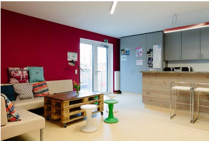
Der neue Jugendbereich.