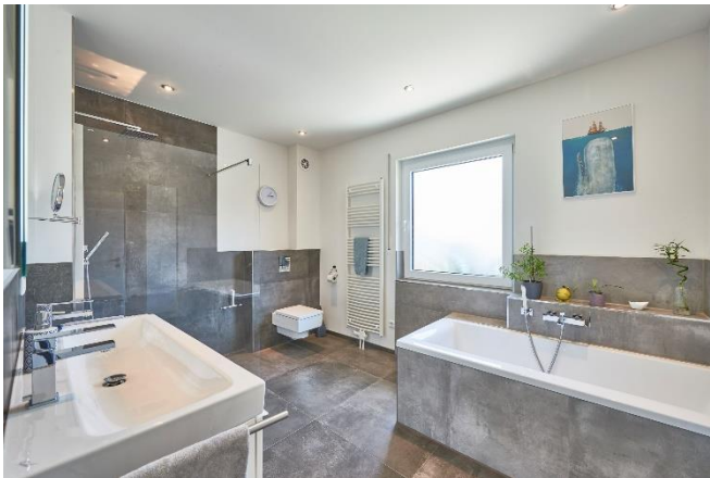
Helles und großzügiges Design lassen das Badezimmer modern sowie einladend wirken.