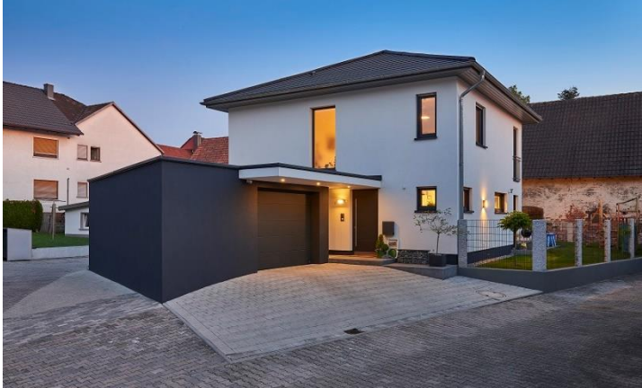
Stadtvilla Arcus 130 – Bauherrenhaus: Die zeitlose Gestaltung der Stadtvilla lässt das Haus von außen in einem klassischen Licht erstrahlen.