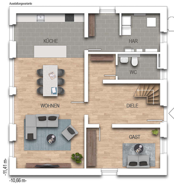
KFN Alto F1K Grundriss EG