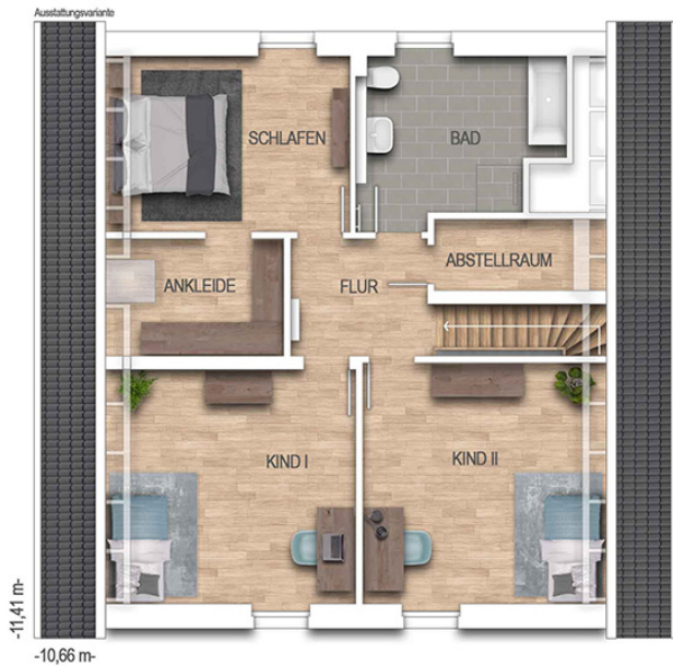
KFN Alto F1K Grundriss DG