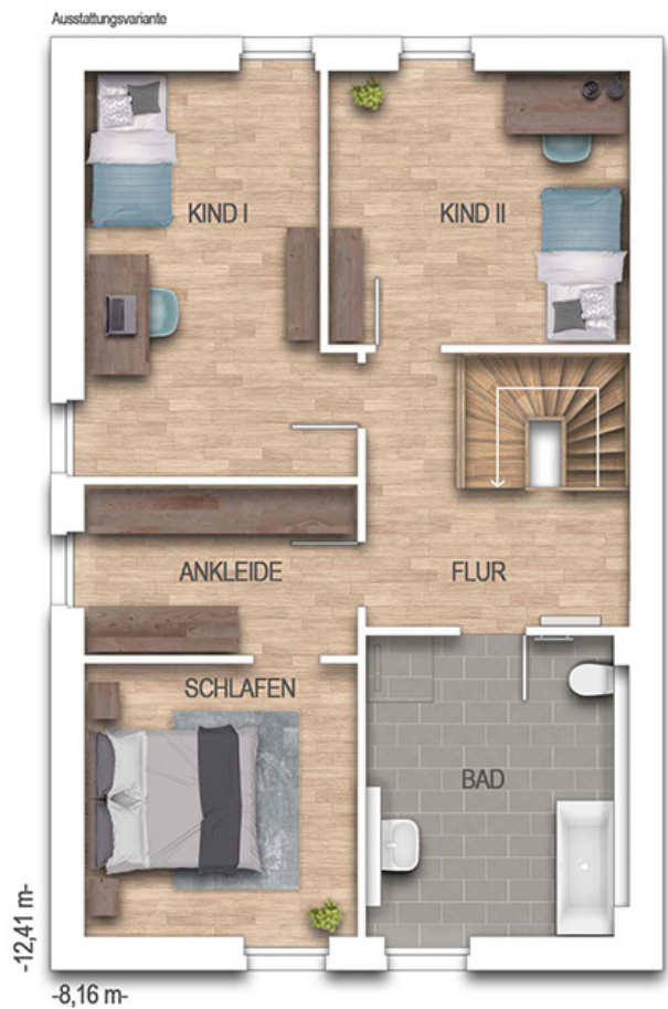
KFN Calvus 34K Grundriss 1.OG