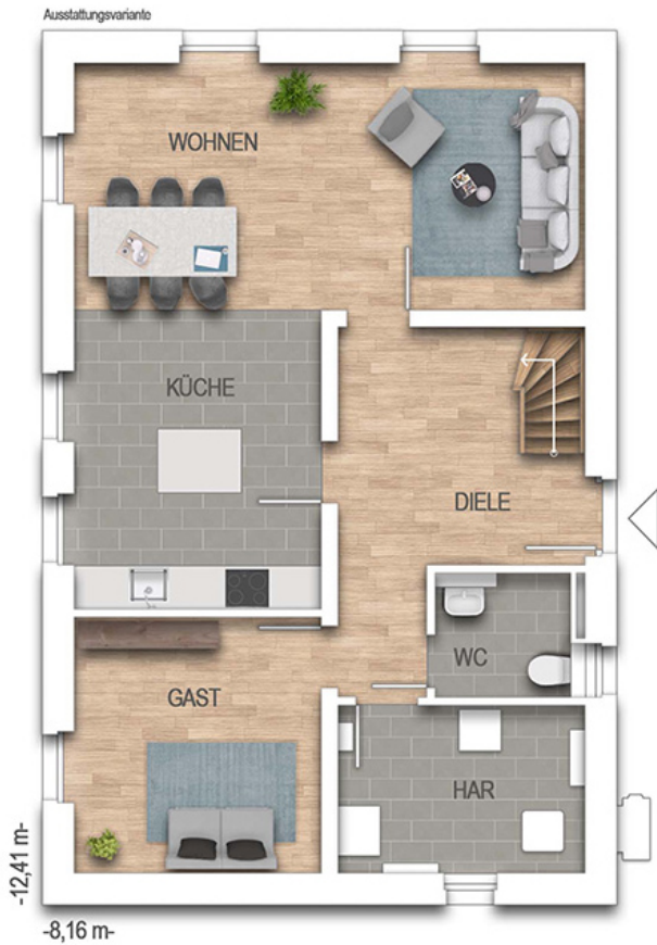
KFN Calvus 34K Grundriss EG