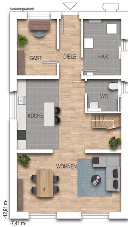
KFN Calvus 36K Grundriss EG