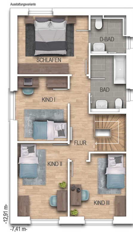
KFN Calvus 36K Grundriss 1.OG