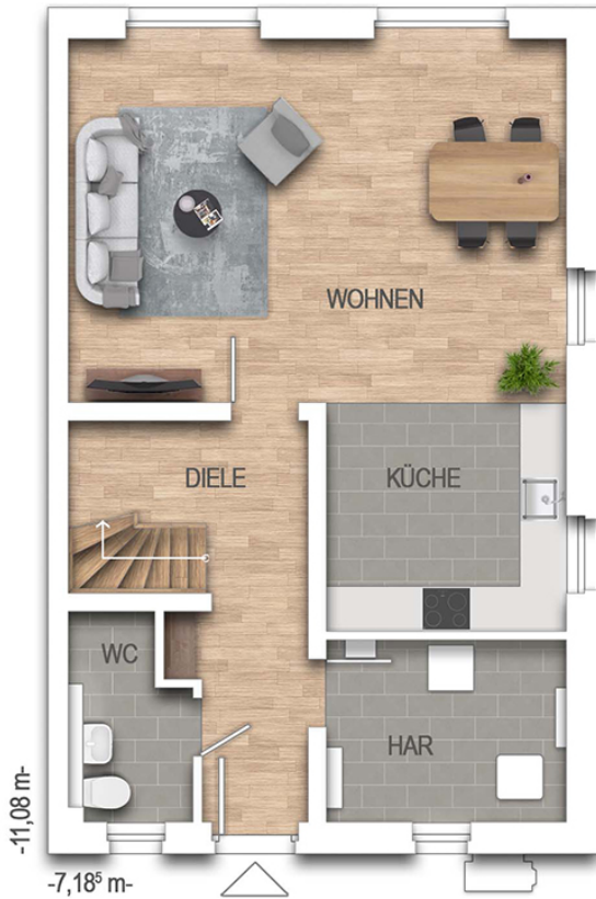
Doppelhaus F554 Grundriss EG