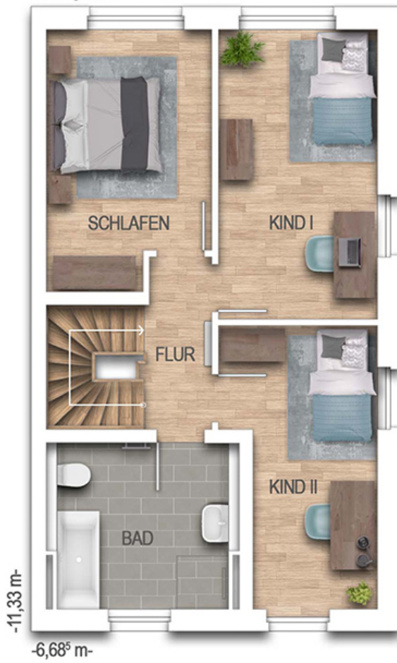
Doppelhaus S454 Grundriss 1.0G