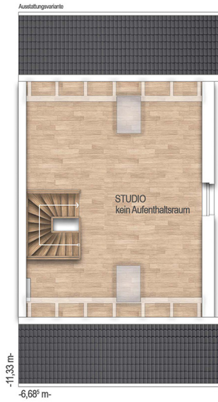
Doppelhaus S454 Grundriss DG