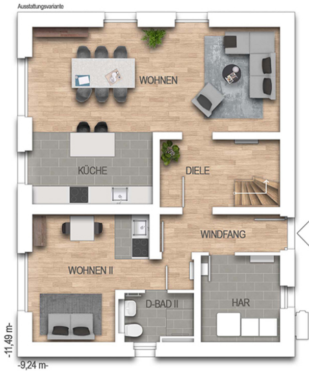
KFN Zweifamilienhaus 64K Grundriss EG