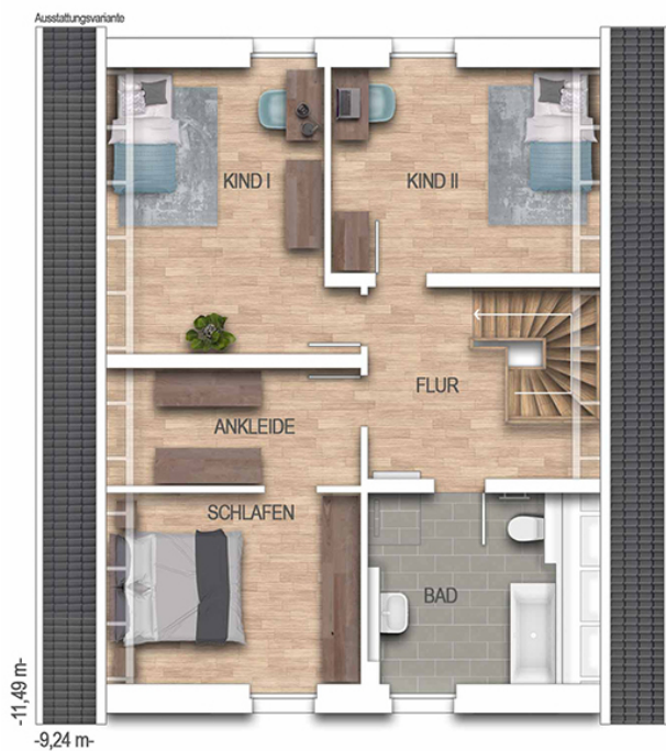
KFN Zweifamilienhaus 64K Grundriss DG