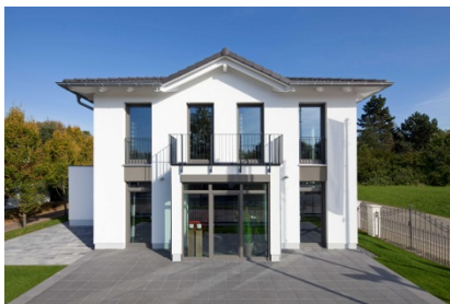
Heinz von Heiden_Musterhaus Köpenick Garten

Das 146 Quadratmeter große Schmuckstück im Süden Berlins präsentiert sich in einer besonders schönen Villenarchitektur, die höchsten Ansprüchen an modernes Design und exklusive Ausstattung gerecht wird. Der Clou: Durch innovative Smart Home-Technologie lassen sich zum Beispiel Beleuchtung, Fußbodenheizung und Jalousien bequem per PC, per Tablet oder sogar per Smartphone von unterwegs steuern. Diese smarte, intelligent vernetzte Gebäude- und Haustechnik bringt ganz einfach mehr Energieeffizienz, Wohnkomfort und Sicherheit.