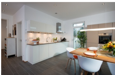
Heinz von Heiden_Musterhaus Köpenick Wohnbereich

Die offene Küche mit dem angegliederten Essbereich bietet Platz zum gemeinsamen Kochen, Essen und Beisammensein.