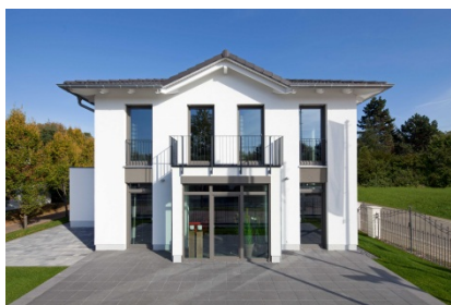
Heinz von Heiden_Musterhaus Köpenick Garten

Beim diesjährigen Deutschen Traumhauspreis wurde Heinz von Heiden mit der Stadtvilla Köpenick in der Kategorie „Familienhäuser“ nominiert. Leser und Internetnutzer können in der Zeit vom 4. Februar bis 4. April 2014 online für ihr Traumhaus abstimmen. Unter www.schwaebisch-hall.de und www.immonet.de stehen die jeweils fünf Häuser in sieben Kategorien zur Abstimmung bereit.