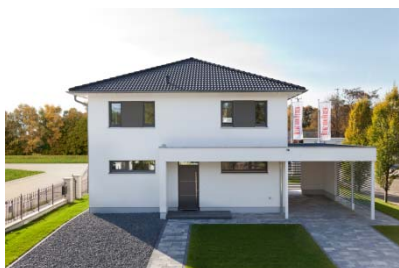
Heinz von Heiden_Musterhaus Köpenick Eingang

Die Stadtvilla Köpenick verbindet moderne Villenarchitektur und geräumiges Wohnen auf zwei Vollgeschossen. Bodentiefe Fenster sorgen für lichtdurchflutete Räume.